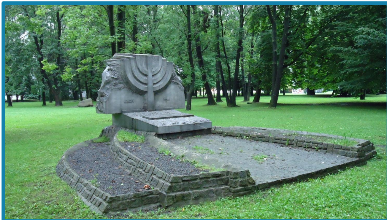
Památník obětem holocaustu v parku Milady Horákové