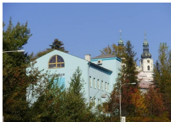
BUDOVA ŽIDOVSKÉ ŠKOLY

Dnes je budova po rekonstrukci a sídlí v ní podnik Chiramax.