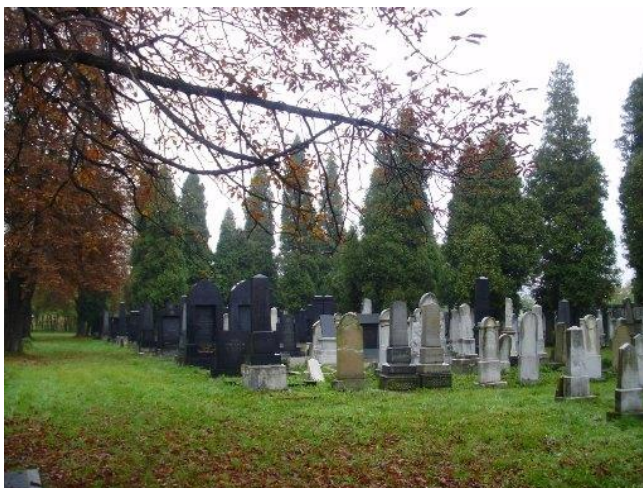
DNEŠNÍ POHLED NA ŽIDOVSKÝ HŘBITOV