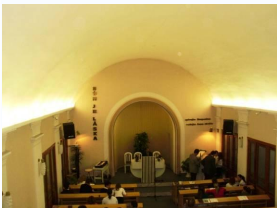
BÝVALÁ SMUTEČNÍ SÍŇ, DNES MODLITEBNA INTRIÉR SMUTEČNÍ SÍŇE DNES

Nacisté v období Protektorátu hřbitov zkonfiskovali, ale k vážnějšímu poškození došlo až za vlády komunistů. V té době ze hřbitova zmizelo velké množství náhrobků.