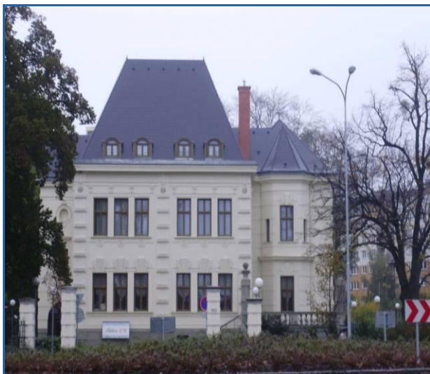
SECESNÍ VILA RODINY NEUMANNŮ

Rodině patří i největší hrobka na místním židovském hřbitově.