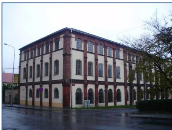
LANDSBERGEROVY TOVÁRNY NA NÁDRAŽNÍ ULICI VE FRÝDKU